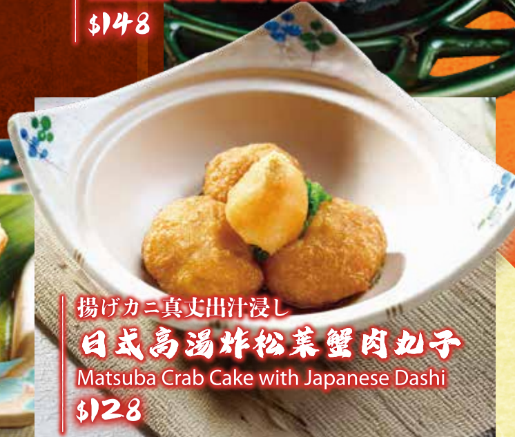
揚げカニ真丈出汁浸し 日式高湯炸松菜蟹肉丸子 Matsuba Crab Cake with Japanese Dashi $128