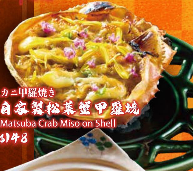
カニ甲羅焼き 自家製松菜蟹甲羅焼 Matsuba Crab Miso on Shell $148