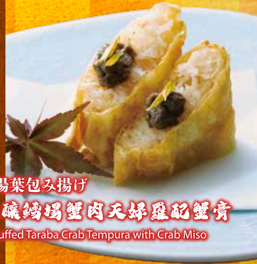
蟹の湯葉包み揚げ 腐皮釀鱈場蟹肉天婦羅配蟹膏 Yuba stuffed Taraba Crab Tempura with Crab Miso $88